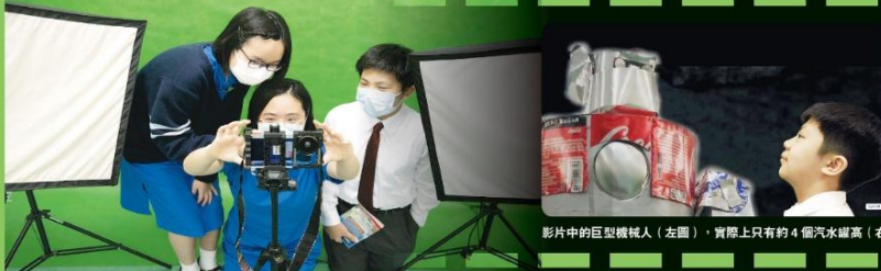
影片中的巨型機械人（左圖），實際上只有約4個汽水罐高（右圖），是日桁、可選和頌思的學兄組留下的「遺產」。

頌思（左）和可選（中）對於黃sir把日桁（右）的「黑屏事件」拍成影片，均認為有趣。可選更就有個事件直說：「很搞笑，因為當時全班都知。」