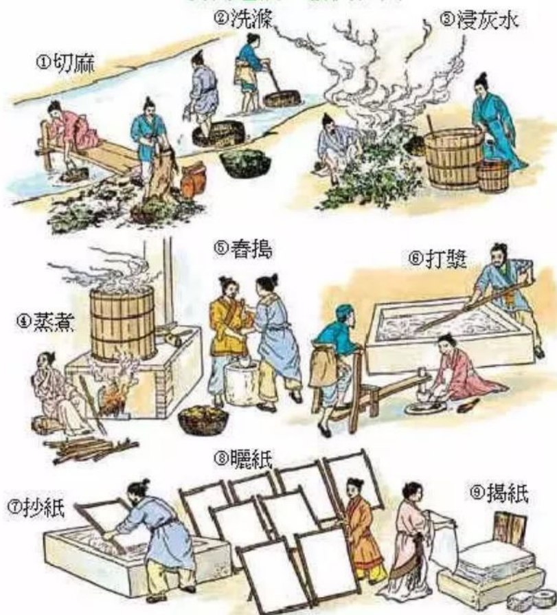
漢代造紙工藝流程圖

這本書讓我們了解中華科技的發展，同時也使我們領略古人的奮鬥與偉大，實在是值得一看的科技書籍。